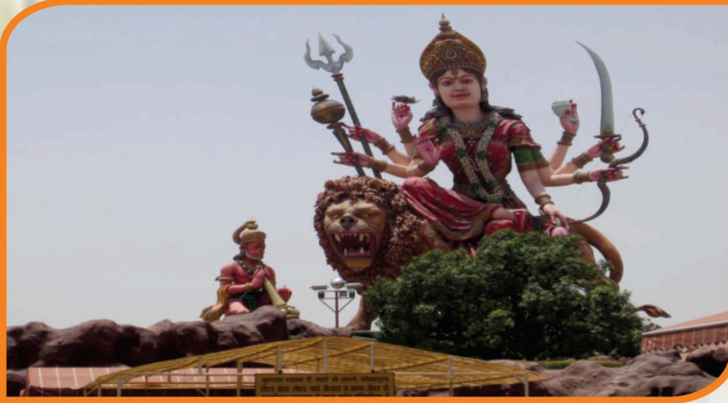
Vaishno Devi Mandir